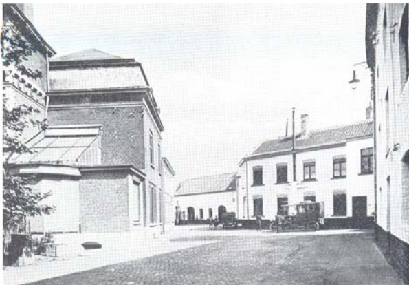
De ingang van de Tiense Suikerraffinaderij in 1915.