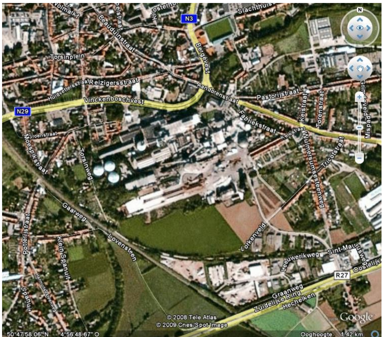
Luchtfoto van het bestudeerde gebied met centraal de suikerfabriek en daar rond de fabriekswijken