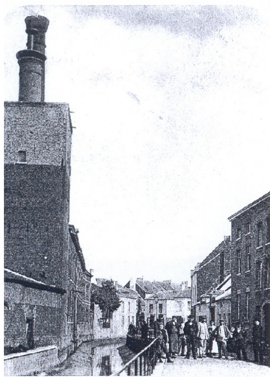
Tirlemont. Rue des Tanneurs.

Op de linkse foto ziet men de Bostsestraat bij het kruispunt met de Huidevettersstraat (rechts) en Reizigersstraat(links). Op de rechtse foto ziet u de Huidevettersstraat, langs de Grote Gete, gaande van de Driemolenstraat naar de Bostsestraat. Deze foto werd genomen in 1905.