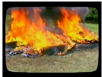
10. De kisten met opgegraven resten worden door tegenstanders in brand gestoken