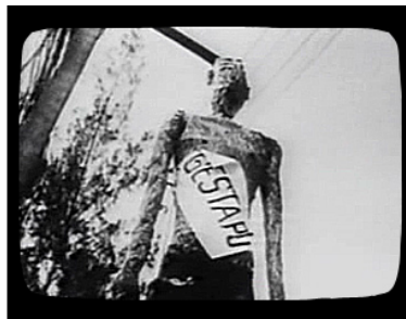
2. de Gestapu moet hangen