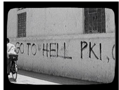
3. anti-PKI leuzen in 1965