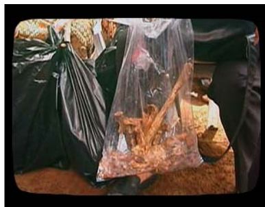
11, 12. Een forensisch expert geeft commentaar op opgegraven resten van vermeende communisten

This is the outer bullet entrypoint. This one inside.