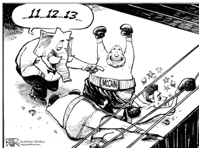
Fig. 10: Voorbeeld van beeldvorming van John McCain – Nate Beeler 06/02/2008

In het persoonlijkheidsprofiel van McCain valt te lezen dat zijn belangrijkste kenmerken 'Dauntless/dissenting, with secondary features of the Outgoing/gregarious and Dominant/controlling patterns' zijn (Immelman en Seifert 2008b). Deze combinatie in zijn profiel impliceert een ' risk-taking adventurer '. Leaders met zo'n persoonlijkheid zijn ondermeer onbevreesd, sensatie-zoekend en worden gedreven door de behoefte om hun moed te bewijzen. McCain wordt verder als onafhankelijk, overtuigend en moedig beschreven. Zijn grootste tekortkoming is impulsiviteit.