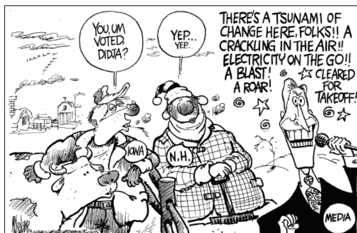
Fig. 1: Voorbeeld van de categorie 'Politieke gemeenplaatsen' – Mike Lane 08/01/2008

Een vierde van de cartoons had als thema een politieke gemeenplaats. Hieronder ressorteren verschillende onderwerpen: het politieke proces, buitenlandse relaties, ect. Aangezien alleen cartoons gecodeerd zijn die rond de campagne draaien, hebben de meeste cartoons in deze categorie het electoriaal 'framework' als onderwerp. Vooral commentaar op het verkiezingsproces en alles wat daar rond hangt, komt frequent voor. Bijvoorbeeld commentaar op de media, de strategie van de kandidaten, enz.