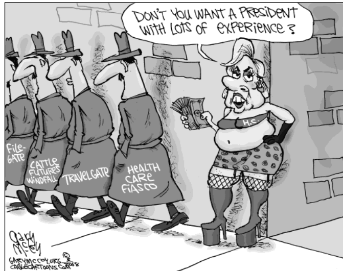
Fig. 8: Voorbeeld van beeldvorming van Hillary Clinton – Gary McCoy 03/03/2008

Deze cartoon gebruikt juist die zogenaamde ervaring om Hillary aan te vallen (McCoy 2008d).