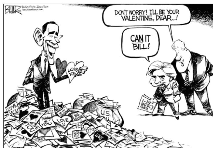
Fig. 4: Voorbeeld van een 'Vakantiereferentie' - Nate Beeler 13/02/2008

Het onderschrift vermeldt dat 'It's mathematically impossible for so few chocolates to taste sooo good!' (Matson 2008a).