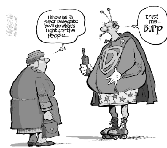
Fig. 5: Voorbeeld van een 'Stripreferentie' – Brian Fairrington 20/02/2008

De laatste subcategorie, film/televisie/reclame, was goed voor 10,87 procent van de culturele referenties waarmee ze op de voorlaatste plaats staan. De cartoon van Matson (2008d), genaamd 'New cast members on Lost', geeft een mooi voorbeeld (fig. 6). We zien de kandidaten die al zijn afgevallen op een poster van de serie Lost.