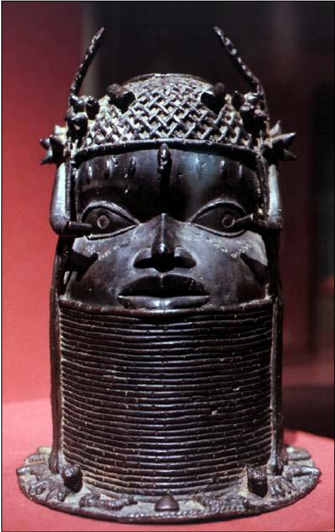
Bijlage 3: Een bronzen Benin-hoofd