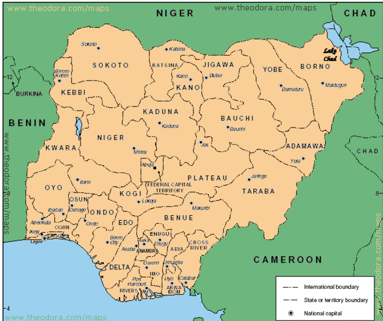
Bijlage 1: Kaart van Nigeria