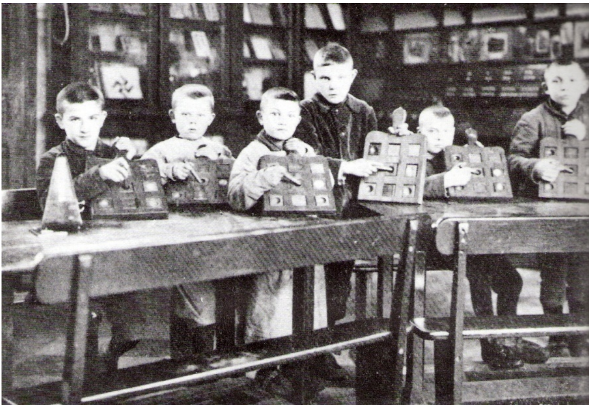
Archief Museum Dr. Guislain

In deze analyse koppelde ik zes foto's, genomen door Br. Ebergiste, aan door hem geschreven teksten. Mijn interpretaties zijn verweven in deze analyse. Vaak schrijf ik 'het lijkt', 'waarschijnlijk' enz. Dit om aan te geven dat het hier gaat om mijn interpretaties die stuk voor stuk gekleurd werden door het lezen van biografieën, artikels en het basiswerk L'Education sensorielle chez les enfants anormaux (Br. Ebergiste, 1922).